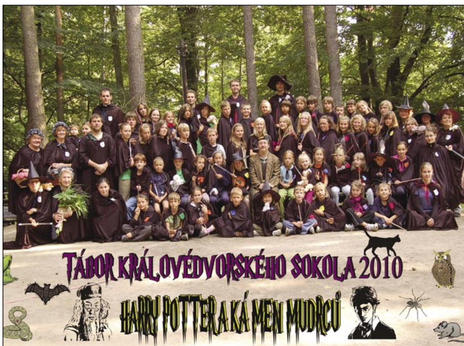
Všichni účastníci tábora